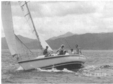
●下田沖クルージング

お問い合わせ 天草ヨットクラブ ホームページアドレス http://homepage2.nifty.com/shoyo/ メールアドレス shoyoclub@nifty.com.