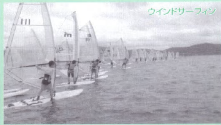
ウインドサーフィン