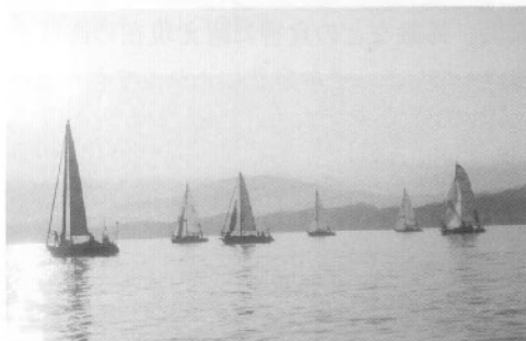
●天草カップの様子